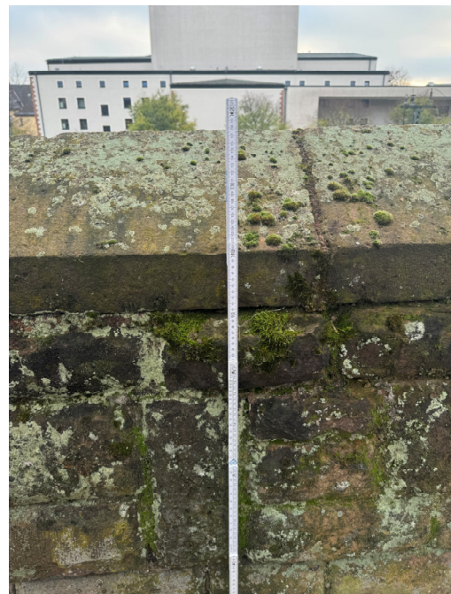
Abbildung 4: Mauerwerk als Böschungsabschluss auf der Höhe der Gutenbergstraße (links) mit einer mittleren Höhe von 1,0 m (rechts)