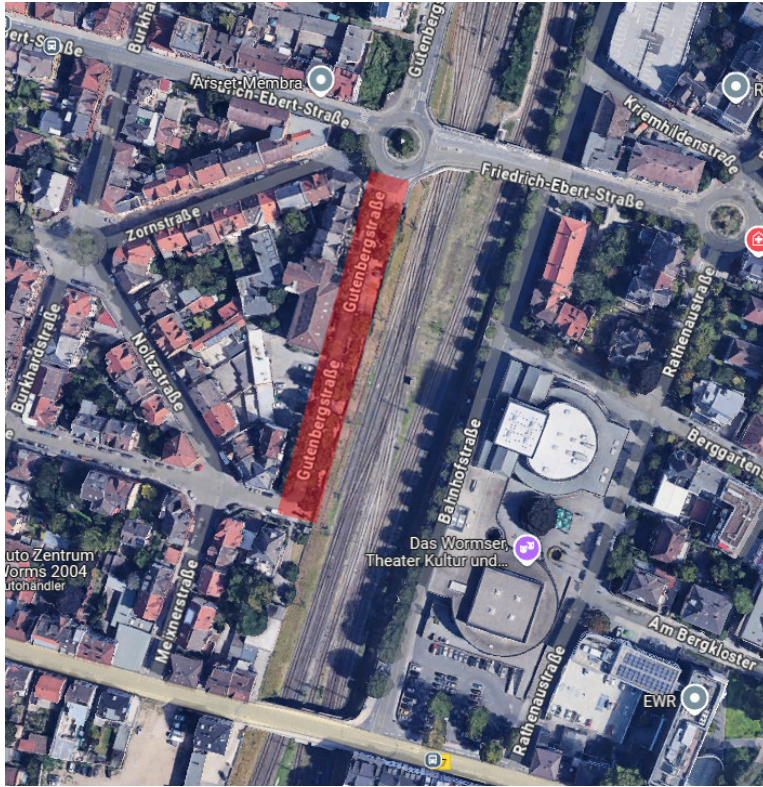
Abbildung 1: Geografische Lage der Gutenbergstraße in 67549 Worms