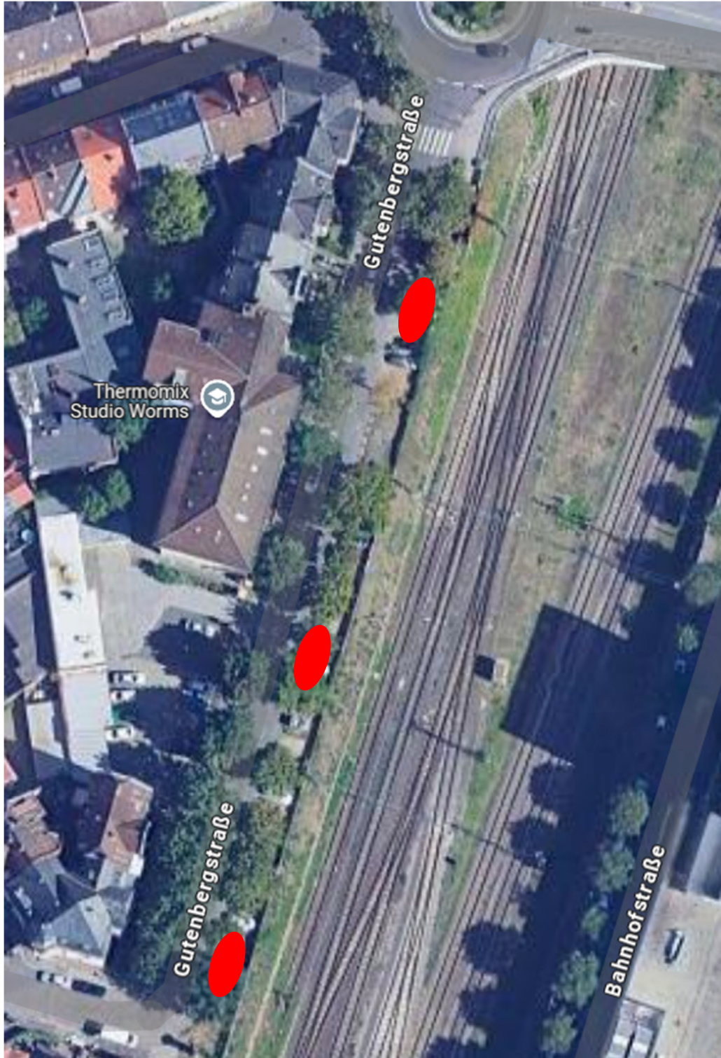
Abbildung 6: Mögliche Stellen für notwendige Schürfe zur Ermittlung der Einbindetiefe des Bestandsmauerwerkes und deren Gründung