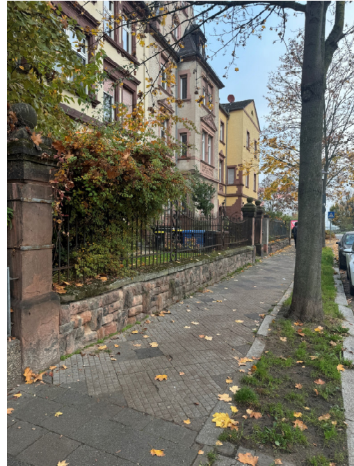
Abbildung 3: Grundstückseinfriedung mit „historisch wertvollem“ Mauerwerk an der Gutenbergstraße 1/2a (links) und 15/17a (rechts)