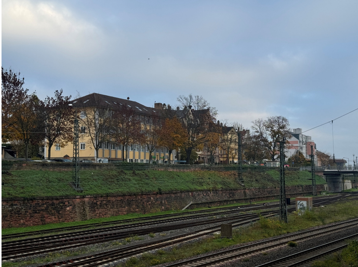
Abbildung 5: Ansicht der Geländeböschung von der gegenüberliegenden Seite (Bahnhofstraße)